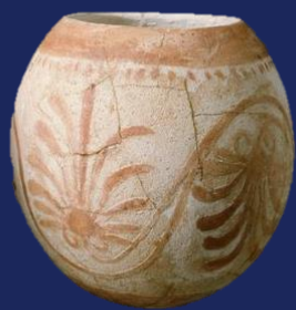
Huevo de avestruz fenicio, pintado 5to / 4to siglo AC Ibiza, Museo Puig des Molins (Balears, España)